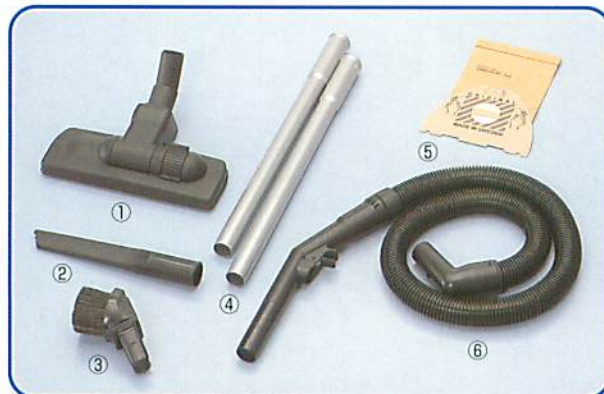
①フロアノズル ②スキマノズル ③コンビネーションブラシ ④延長パイプ ⑤ペーパーバッグ (5枚入) ⑥ホース