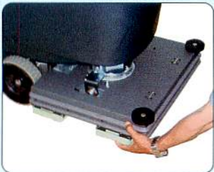
パッド台はマグネット式になっており脱着が簡単です。