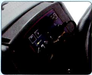
コントロールパネルはワンタッチで作業開始