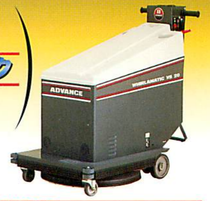
ホイラーマチックVS20 バッテリー式自走式2000回転

高性能のバーニッシャーで バフイングすると、 スーパー・ウェット・ルック (最高級の光沢質感) が得られます。