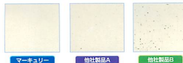
■ 約一か月後の光沢落差