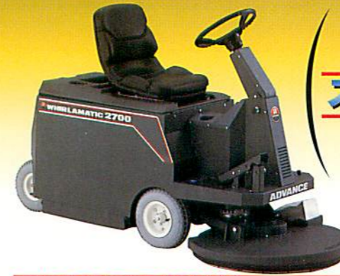
ホイラーマチック2700 バッテリー式乗用型バーニッシャー